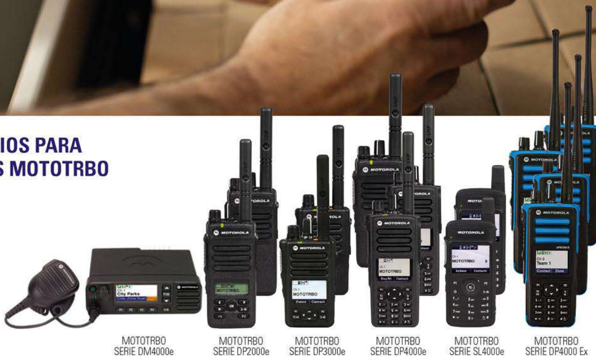
MOTOTRBO SERIE DM4000e